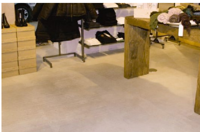
Fliessestriche sind als Fertigbelag im nichtindustriellen Bereich geeignet und werden direkt als ästhetisches Mittel eingesetzt.