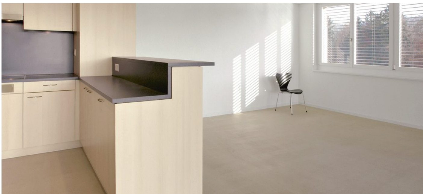
Versiegelte Böden aus calciumsulfatgebundenen Fliessestrichen erfreuen sich grosser Beliebtheit.

Falls der Rohboden in seiner Höhenlage ausserhalb der Norm liegt, muss zunächst ein Rohbodenausgleich vorgenommen werden (z.B. Styroporbeton). Um die Spannungen im Boden so gering wie möglich zu halten, ist eine gleichmässige Beheizung erforderlich. Die Norm SIA 251:2008 Ziffer 2.6 ist unbedingt einzuhalten. Wir verweisen hier auf den Artikel